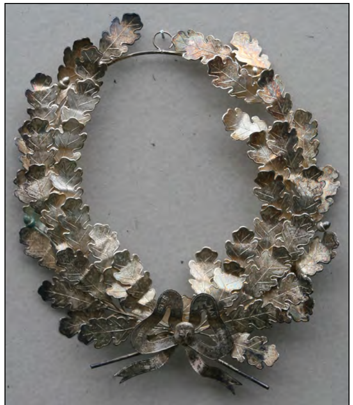
Penningen en een lauwerkrans.