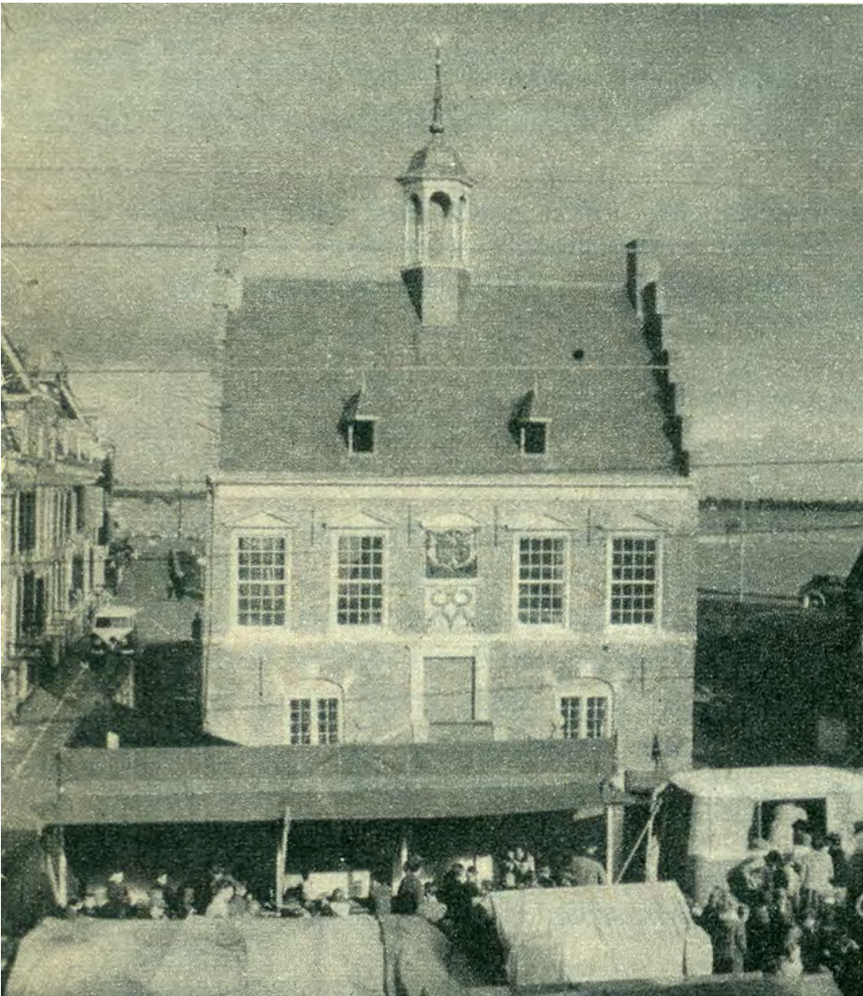
Het fraaie stadhuis van Ameide, dat de Ambachtsheer van deze gemeente twee jaar geleden aan de gemeenteraad schonk. Men was nog druk bezig met de restauratie. In het torentje komt 'n klokkenspel.

De tweede donderdag van oktober in 1960 had eigenlijk een bijzonder feestdag moeten zijn, want het was de bedoeling het gerestaureerde stadhuis in gebruik te nemen. Maar de restauratie is wat gestagneerd en nu duurt het nog een week of wat voor Ameide zijn stadhuis weer kan gebruiken. U vindt het vreemd: stadhuis voor een dorpje van netaan tweeduizend inwoners?