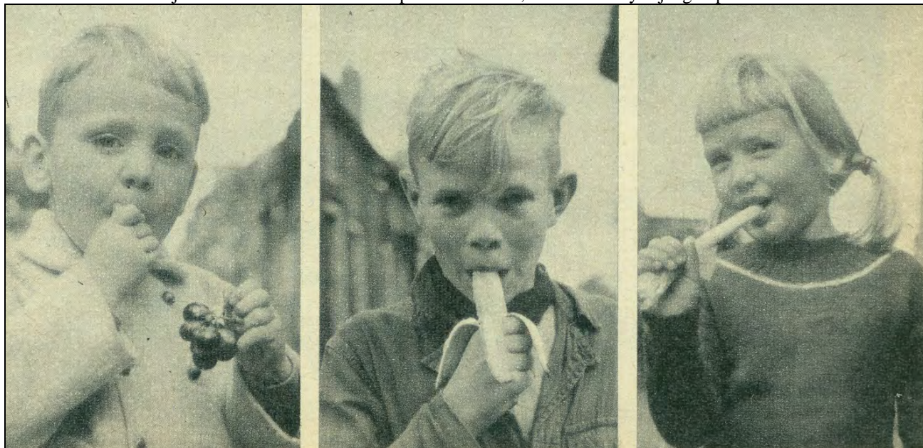
Terwijl moeder in de keuken de soep staat te roeren, eet de Termeyse jeugd op de markt