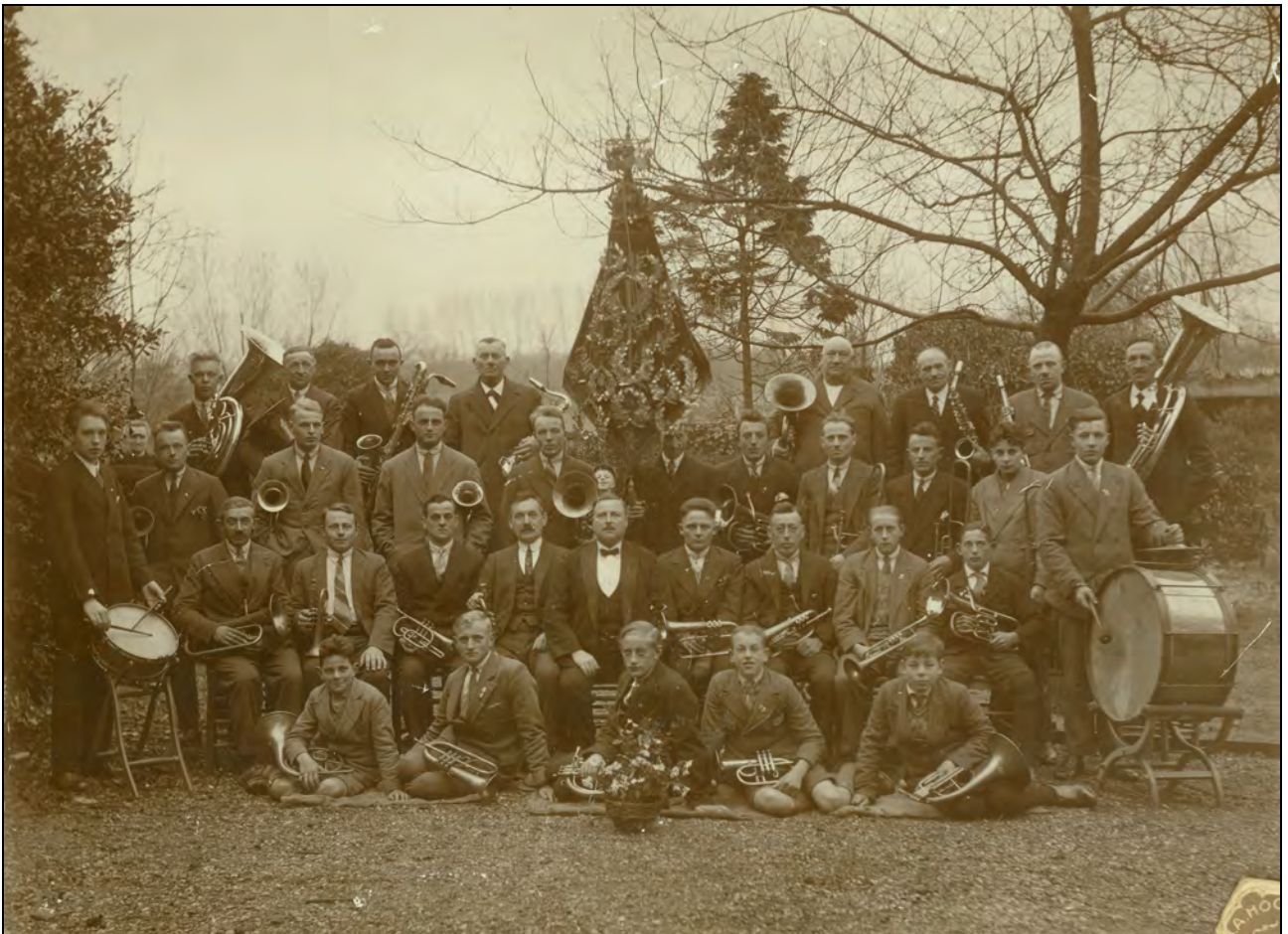
Een naar alle waarschijnlijkheid uit de jaren dertig van de vorige eeuw daterende foto van de "Unie". Een vergroting van deze foto wordt getoond tijdens de expositie.