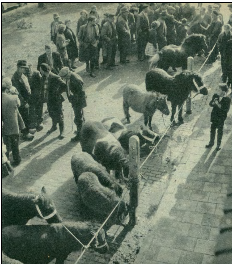
Dit jaar waren behalve 150 paarden ook een aantal pony's aangevoerd, die we hier in het zonnetje langs de Prinsegracht in Ameide zien staan. Dit was de eerste pony-markt in Zuid-Holland.

“Och, meneer, een mens wil ook wat plezier in zijn leven en in Termey valt vandaag heus nog wel wat te lachen.”