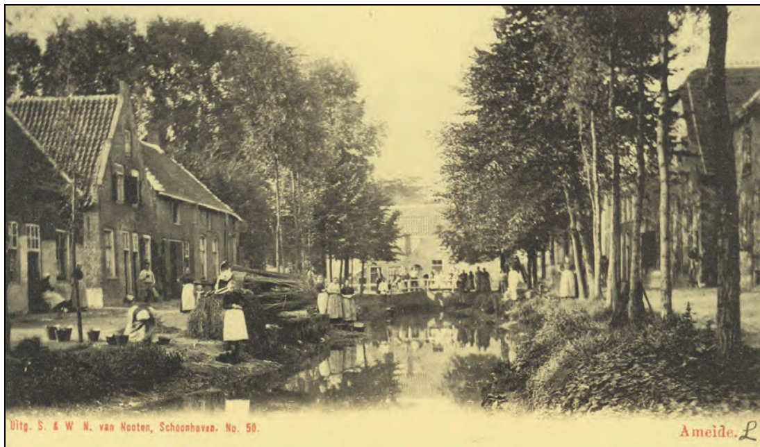
Deze plek in het dorp had een deftige naam: „De Prinsengracht”! Het water was echter zwaar vervuild. Niet alleen spoelden de vrouwen hier hun was, maar ook het rioolwater en ander afval kwam in het water terecht. Wel werd van tijd tot tijd het water ververs met Lekwater (toen nog niet vervuild), dat via een duiker in de dijk onder de Dam en het hoekhuis op de Dam door, langs de Kerkstraat en wederom onder de weg door, in de grachten werd geleid. In de jaren dertig werden de grachten als werkverschaffingsobject gedempt. Een stukje romantiek is toen wel verloren gegaan.