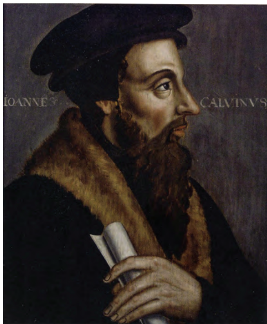
Johannes Calvijn (1509-1564)