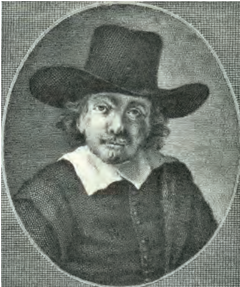
Jeremias de Decker (1609-1666)

Waer heeft Vorst Frederick oyt Leger neergeslagen Dat ick niet trouwelijck en hebbe bygewoont, Daer ick niet vromelijck mijn lijf heb derven wagen, En van mijn dapperheyd geen proef en heb getoont? Al voel ick 't Graffelijck bloed noch door mijn aeren ryen, Ik hebbe niettemin den Nederlandschen Staet Van 't Graeffelijck jock kloeckmoedig helpen vryen, En hem bey met rappier gehandhaeft en met raed.