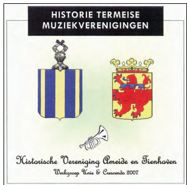
hoesje van de CD-rom