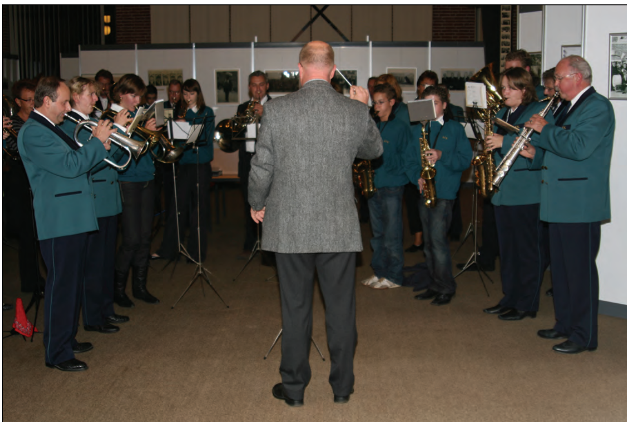
AFK tijdens de opening van de tentoonstelling