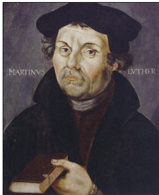
Maarten Luther (1483-1546)