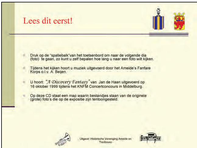
openingspagina van de CD-rom