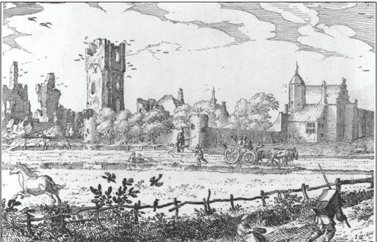
Het huis ter Cleef bij Haarlem.