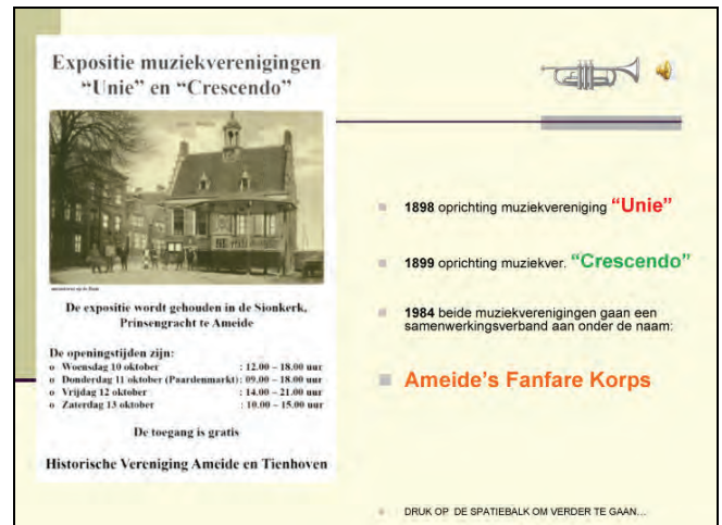
tweede bladzijde van de CD-rom

Deze CD-rom is te bestellen via de website van onze vereniging www.ameide-tienhoven.nl De kosten van de CD-rom bedragen Euro 12,50 exclusief eventuele verzendkosten.