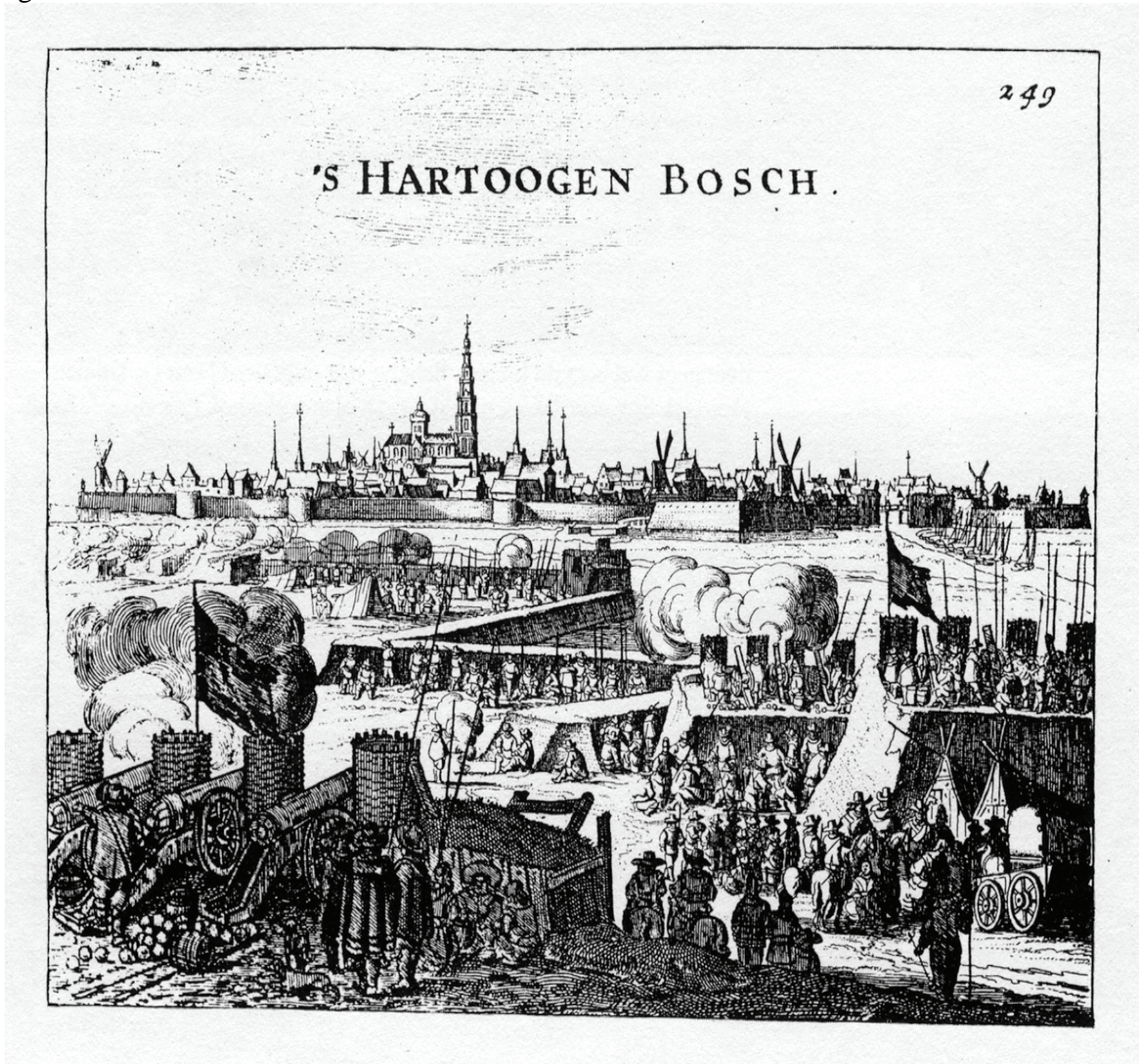
Het beleg van 's-Hertogenbosch.