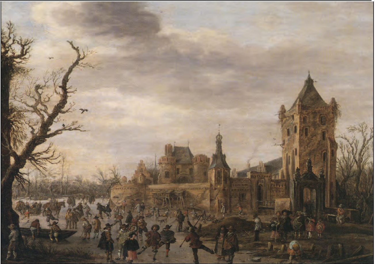
Jan van Goyen, Kasteel Batestein, verblijfplaats onbekend.