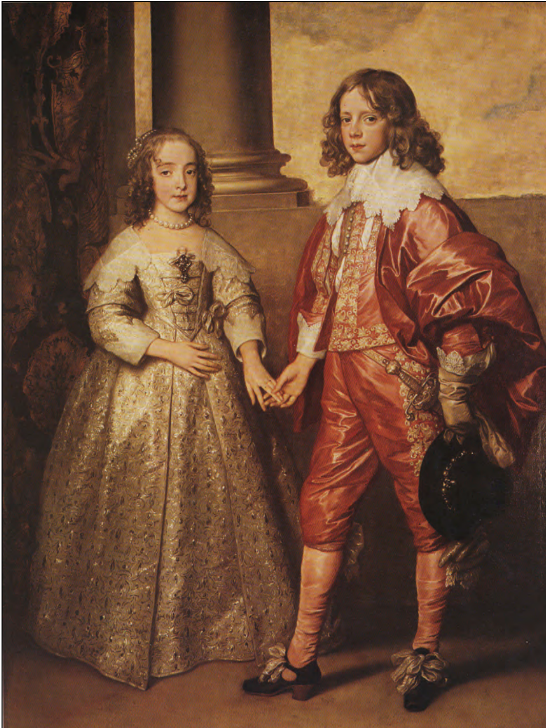
Anthoon van Dyck, Bruidspportret van Willem II (1626-1650) en Mary Stuart (1631-1660), dochter van Karel I van Engeland, 1641, olieverf op doek, 182,5 x 142 cm. Rijksmuseum Amsterdam.

Kort voor deze laatste verheffing gaf hij, met drie schepen naar Engeland zeilende, een wakker bewijs van zijnen heldenaard. Onverwachts door vijf Duinkerker kapers aangevallen, spoedde hij zich, ongewapend en nog in zijnen slaaprok naar het dek en gaf zijne bevelen met zoo veel beradenheid en onverschrokken moed, dat de roovers, niettegenstaande hunne overmagt, na een hevig gevecht van ongeveer vier uren, zich gedrongen zagen, af te houden en hem zijnen togt ongehinderd te laten voorzetten.