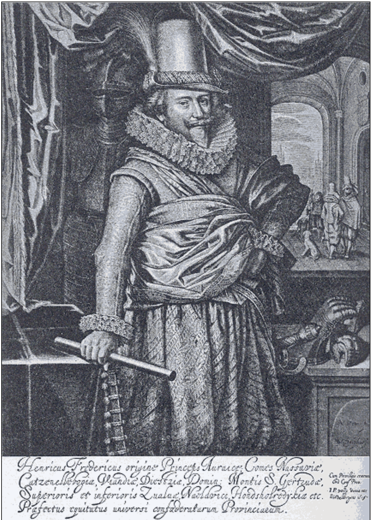
Frederik Hendrik (1584-1647) als generaal der ruitelij. Prent van W. Delff naar de schilderij van Adriaen van de Venne.

wettig mansoir 2 van deze tak van het geslacht van Brederode was. Door zijn tweede huwelijk was hij een zwager van Frederik Hendrik, Prins van Oranje.