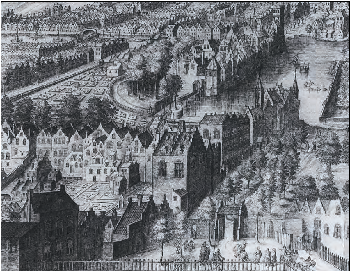
Het Hof van Brederode bij de Boschpoort in den Haag.