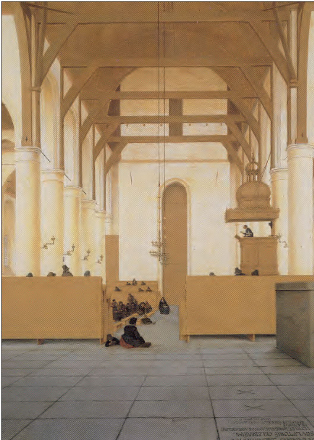
Pieter Saenredam, Koor en schip van de Sint-Odulphuskerk in Assendelft, gezien vanuit de rechterkant van het koor, (detail). Gesigneerd, gedateerd 2 oktober 1649. Paneel, 50 x 76cm. Amsterdam, Rijksmuseum.