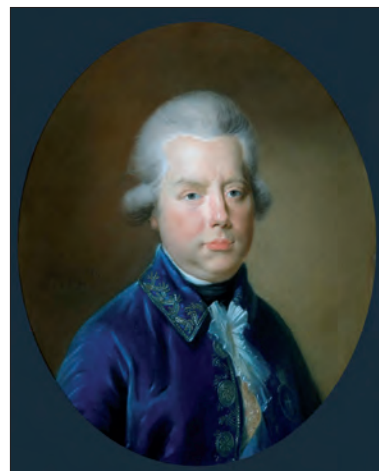
Willem V (1748-1806) Getekend door J. Tischbein, pastelkrijt op velijn. 62,5 x 52 cm. Rijksmuseum, Amsterdam.