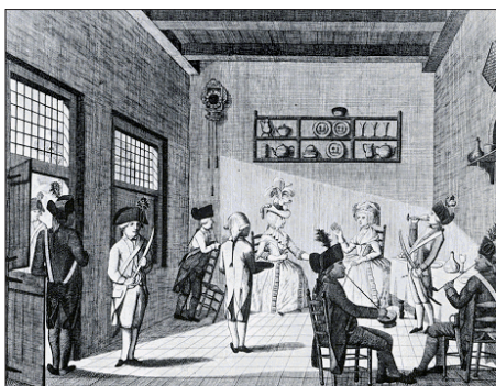
De aanhouding van prinses Wilhelmina te Goejanverwellesluis op 28 juni 1787. Gravure door Gottfried Arnold Lehmann.