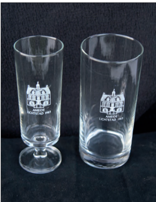
Een bierglas en een wijnglas, beide uit 1983.