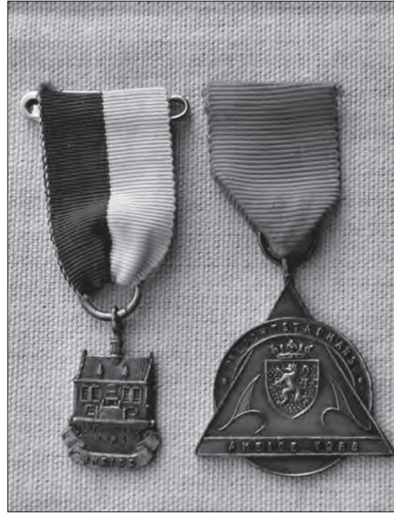
Enkele medailles van de wandeltochten uit 1968, die "Lichtstadmars" werden genoemd.