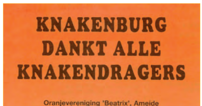
De Termeise reactie op het krantenartikel.