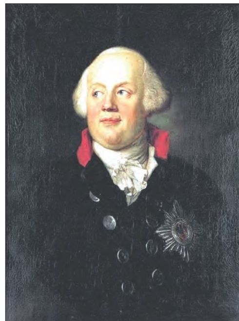
Koning Frederik Willem II van Pruisen (1744-1797) Olieverfschilderij van Anton Graf.

De mislukte expeditie van de Prinses had verstrekkende gevolgen, omdat koning Frederik Willem II van Pruisen zich het lot van zijn zuster aantrok. Deze in 1744 te Berlijn geboren neef en opvolger van Frederik de Grote gaf er blijk van goed op de hoogte te zijn van de internationale situatie toen hij inschatte dat de Fransen geen steun zouden verlenen aan de Patriotten. Dat bracht hem ertoe op 8 september 1787 per ultimatum genoegdoening te verlangen van de Staten van Holland. De Staten reageerden niet, waarop de koning van Pruisen besloot tot militair ingrijpen.