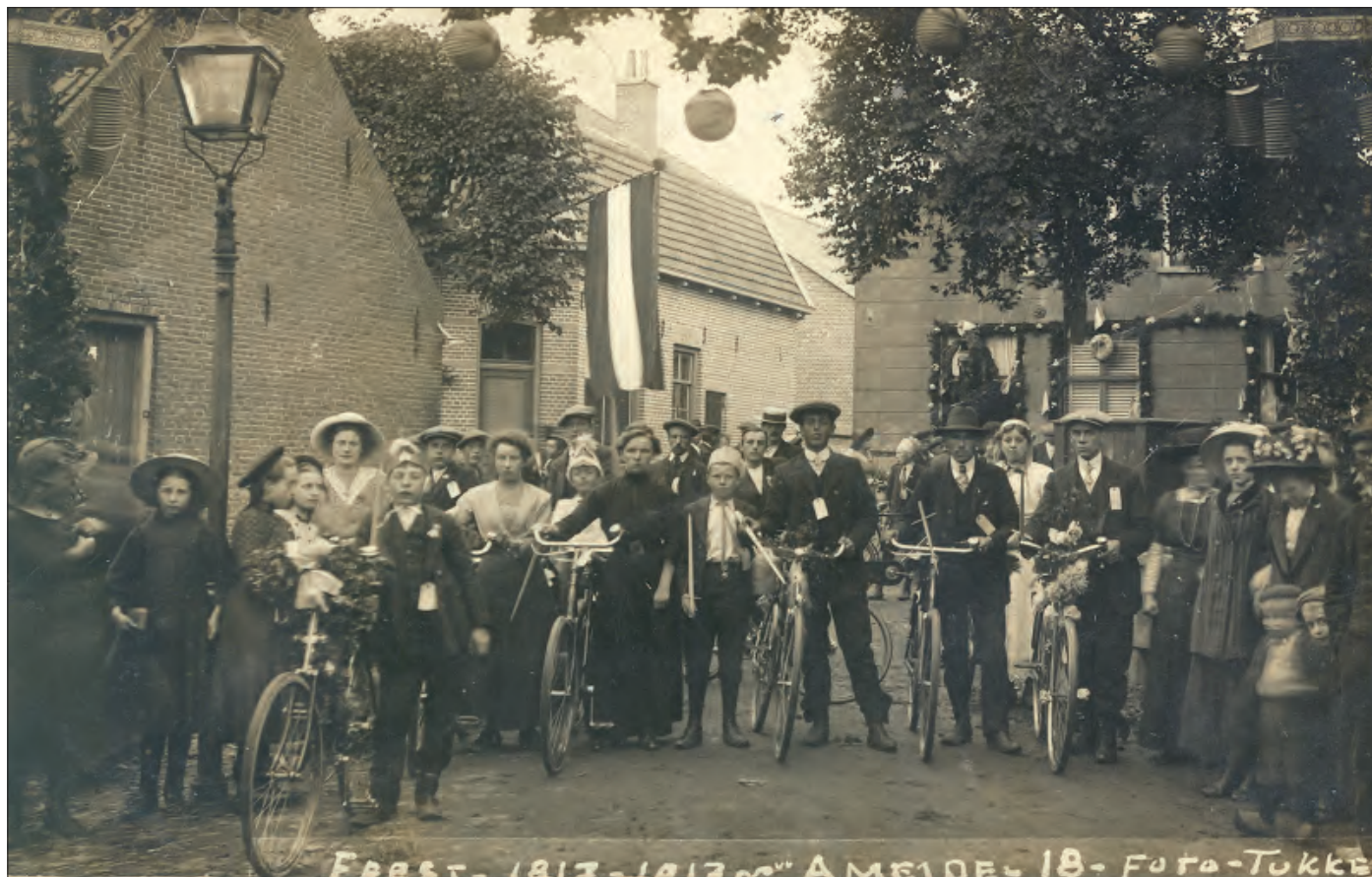
Foto 18 : Het "ringsteken" vormde ook in 1913 een onderdeel van het feestprogramma. De deelnemers aan dit oude volksvermaak hebben zich hier opgesteld aan het begin van de Prinsengracht, voor het kantoor van de vroegere meelfabriek van Kruyt, thans "Ranks Meel".