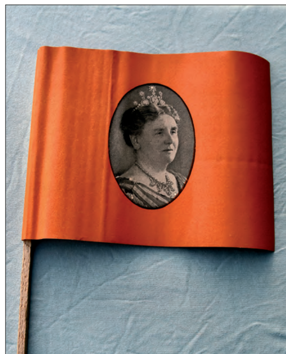
Een feestvlaggetje met de afbeelding van de koningin.