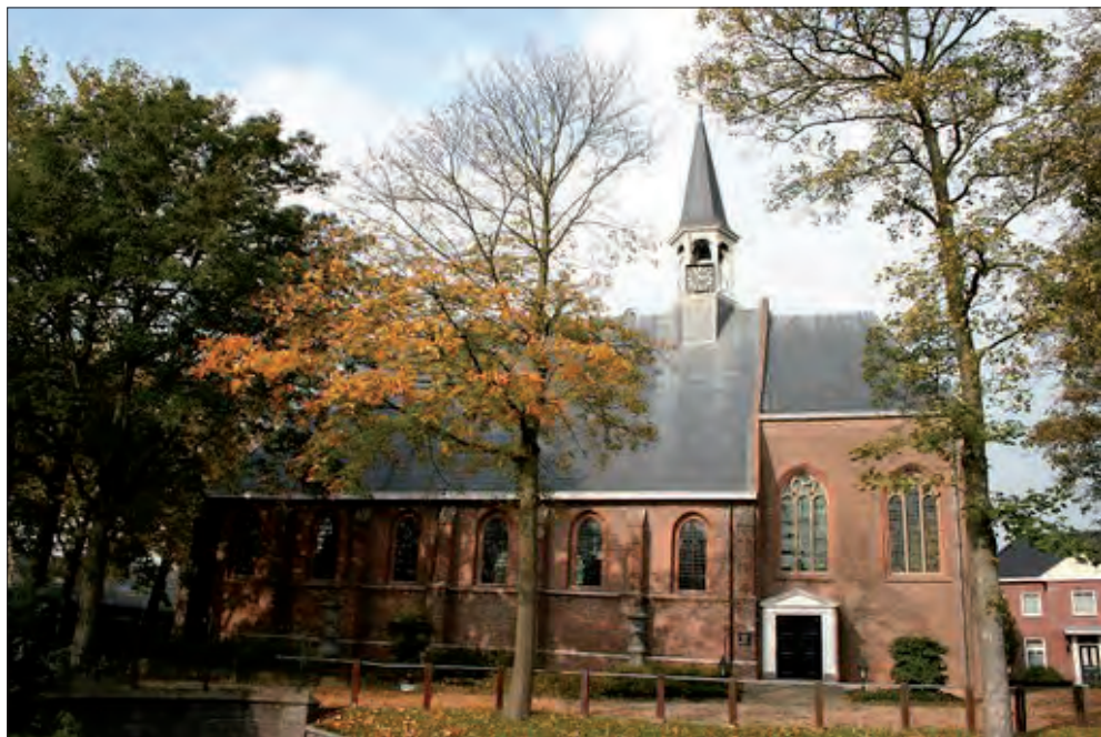
Hervormde kerk Hei- en Boeicop (ca. 1300).