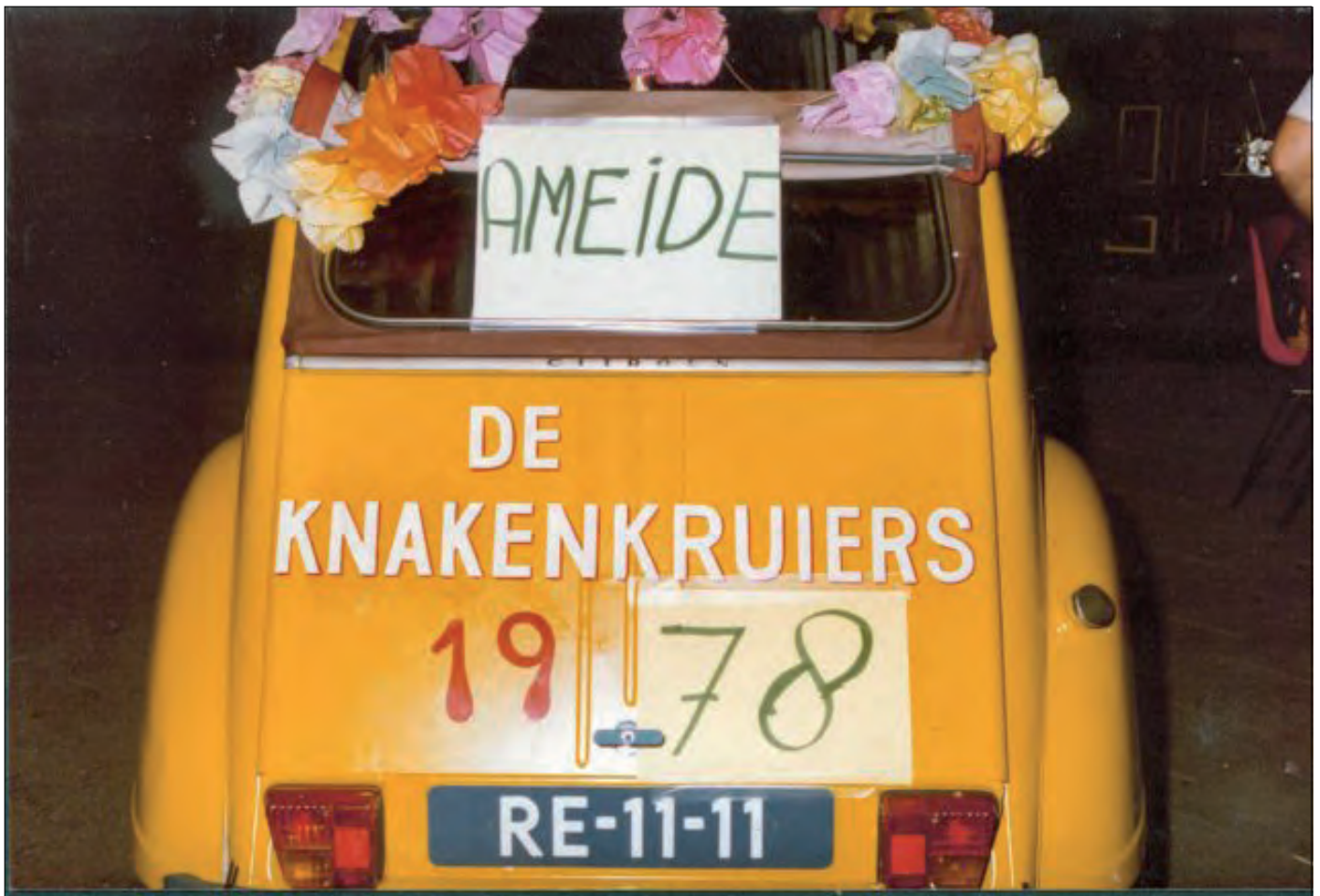
Uit deze foto blijkt dat de "De Knaak" in 1978 ook al veel reacties teweeg bracht.