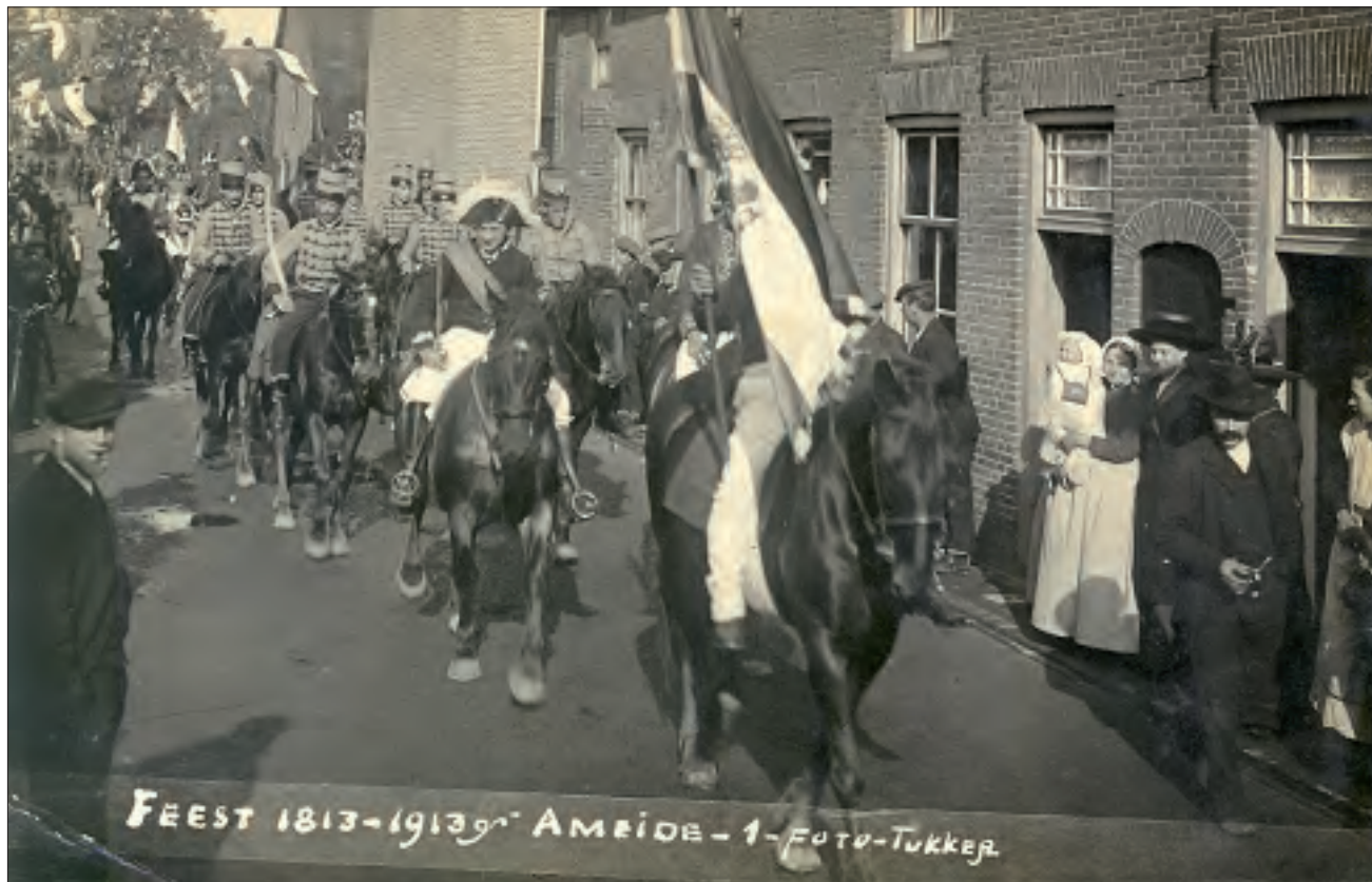
Foto 1 : De kop van de “allegorische optocht”, gefotografeerd op de toen nog Achterweg geheten J.W. van Puttestraat, ter hoogte van de Fransestraat.

Het honderdjarig bestaan van het Koninkrijk der Nederlanden werd in Ameide in 1913 uitbundig gevierd. De Gorinchemse fotograaf Tukker maakte twintig foto's van de feestelijkheden, waarvan de nummers 1, 5, 7 en 18 op deze en de volgende pagina zijn weergegeven.