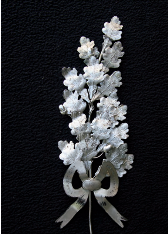
Een prachtige lauwertak uit 1958 voor de beste zang- of muziekprestatie. Op de strik staat: "Oranjefeest, Ameide 1958, 1e prijs".

D e in het vorige nummer van dit blad afgedrukte foto's hebben enkele leuke reacties opgeleverd. Dank daarvoor! Ditmaal is het thema "Termeise feestherinneringen". Sinds jaar en dag speelt de Oranjevereniging "Beatrix" bij de plaatselijke feesten een belangrijke rol. Zo heeft de vereniging in de loop der jaren allerlei attributen in omloop gebracht om de festiviteiten in de herinnering te laten voortleven.