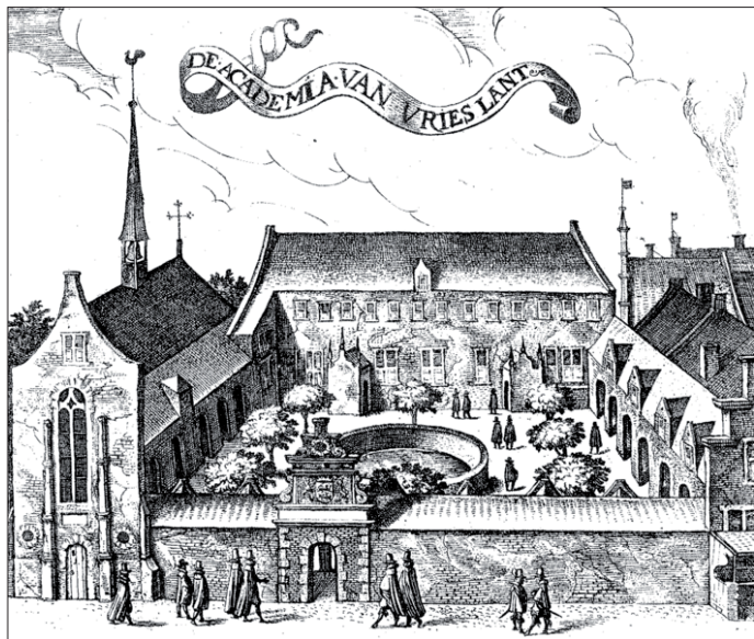
Universiteit van Franeker, gehuisvest in het voormalig Kruissherenklooster.

Hij werd geboren in Oldenzaal en studeerde in Franeker theologie (1616). In 1635 wordt hij nogmaals ingeschreven als student in Franeker, nu als kandidaat in de medicijnen.