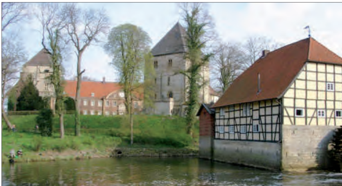
Slot Rheda bij Gütersloh in Duitsland.