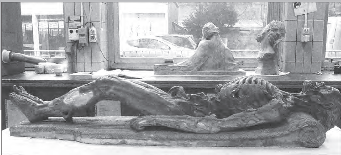
'De man met de wormen', het kadaver-beeld uit het Belgische Boussu, hier voor restauratie bij het Koninklijke Instituut voor het Kunstpatrimonium in Brussel.