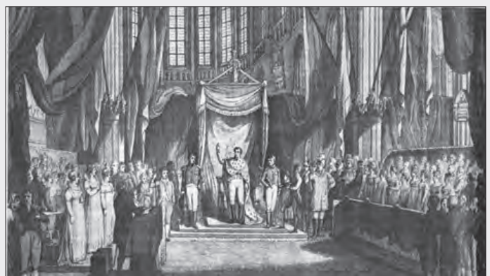
De inhuldiging van Willem I als soeverein vorst in de Nieuwe Kerk te Amsterdam.