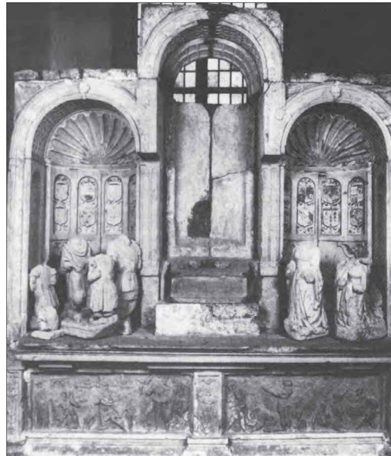
Altaarretabel in de grafkapel. (1540) Verwijderd tijdens de reformatie en in verval geraakt. Rond 1800 werden de resten weer opgesteld.