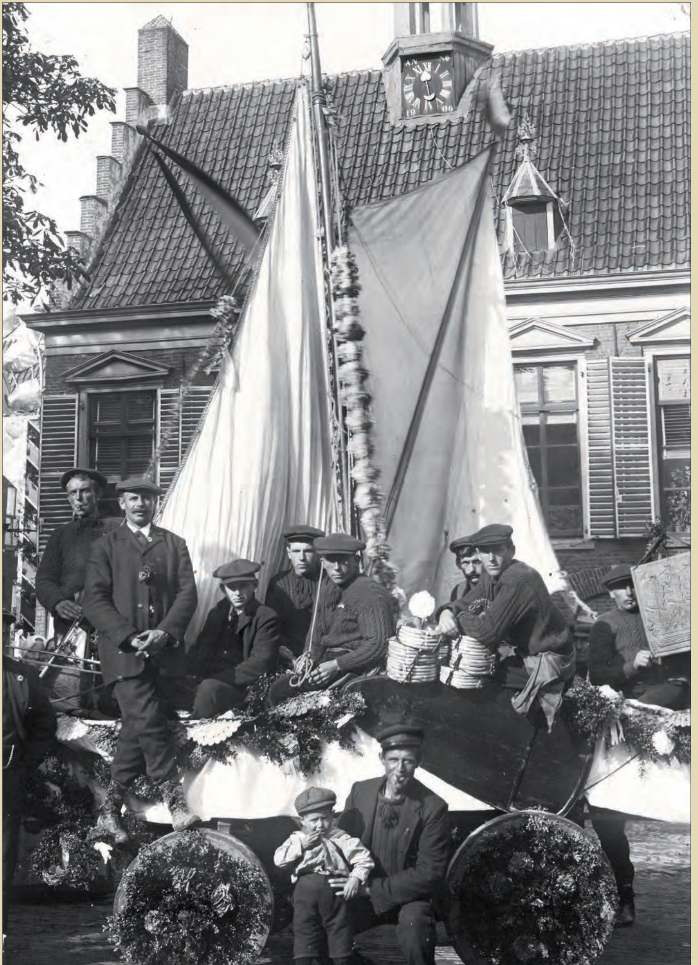
Onafhankelijkheidsfeest Koninkrijk der Nederlanden in Ameide en Tienhoven (1813-1913).