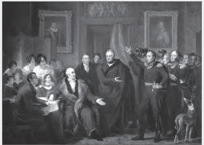
De aanvaarding van het Hoog Bewind door het Driemanschap in naam van de prins van Oranje op 21 november 1813 ten huize van G.K. van Hogendorp.

Op 6 December 1813 dechargeerde Vorst Willem de Eerste het Algemeen Bestuur. Daarmee was in de noordelijke Nederlanden de Staatsomwenteling van het Franse Keizerrijk naar de Souvereiniteit der Vereenigde Nederlanden voltooid. Door het Congres van Wenen werden de Noordelijke Nederlanden met de Zuidelijke Nederlanden samengevoegd om een sterke buffer te vormen aan de noordgrens van Frankrijk. Op 16 maart 1815 nam soeverein vorst Willem I zelf de titel koning der Nederlanden aan. Hij werd ook hertog van Limburg en groothertog van Luxemburg. Voor de inhuldiging in de Nieuwe Kerk is een houten model van een kroon met goud beschilderd, blijkbaar was er zo snel niets anders voorhanden. Zo ontstond een Verenigd Koninkrijk der Nederlanden.