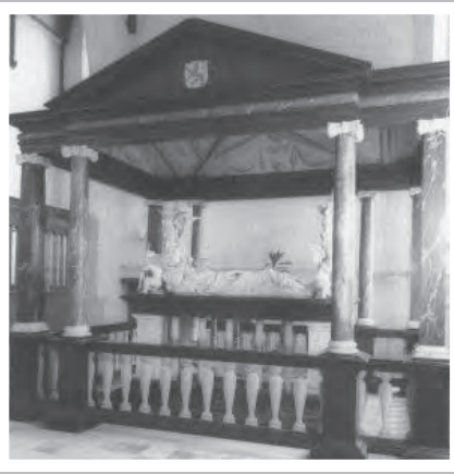
De 17 e eeuwse baldakijn over het 16 e eeuwse grafmonument van Reinoud van Brederode en Philip-pote van der Marck.