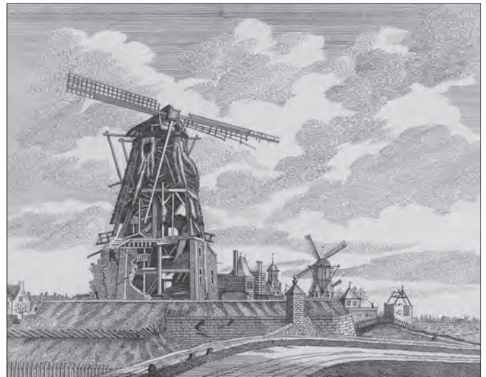
Gezigt der ruïne van den pelmolen te Gorinchem, kort na het springen der kruitkisten op den 30 januarij 1814, van buiten de stad te zien. Van prentmaker: Johannes van Hiltrop, naar tekening van: Cornelis de Jonker.

Prenten van Cornelis de Jonker en Arnoldus Lamme geven een voortreffelijk beeld van de aangerichte schade aan de molen: de romp boven de stelling was volledig opengereten, de muren van het stenen onderstuk voor een deel weggeslagen, de vernielde gaande werken werden zichtbaar, de stelling was grotendeels weggevaagd, één der roeden afgebroken, terwijl alle hek- en scheerlatten verdwenen waren. Werkelijk een troosteloos ruïne, waar alleen nog maar plaats was voor de sloper.