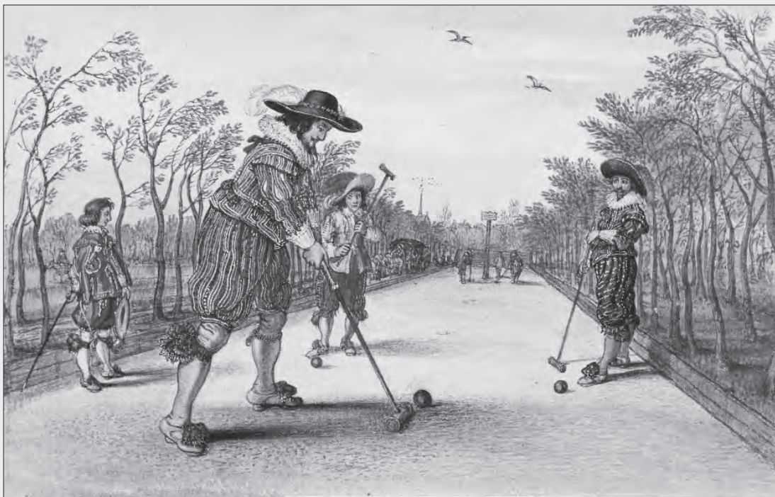
Maliespel, gespeeld door Frederick van Bohemen, de Winterkoning, met rechts 'onze' Frederik Hendrik op de Maliebaan te Den Haag. Adriaen van de Venne, ca. 1620/26.