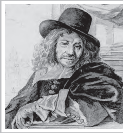
Jacob van Campen.