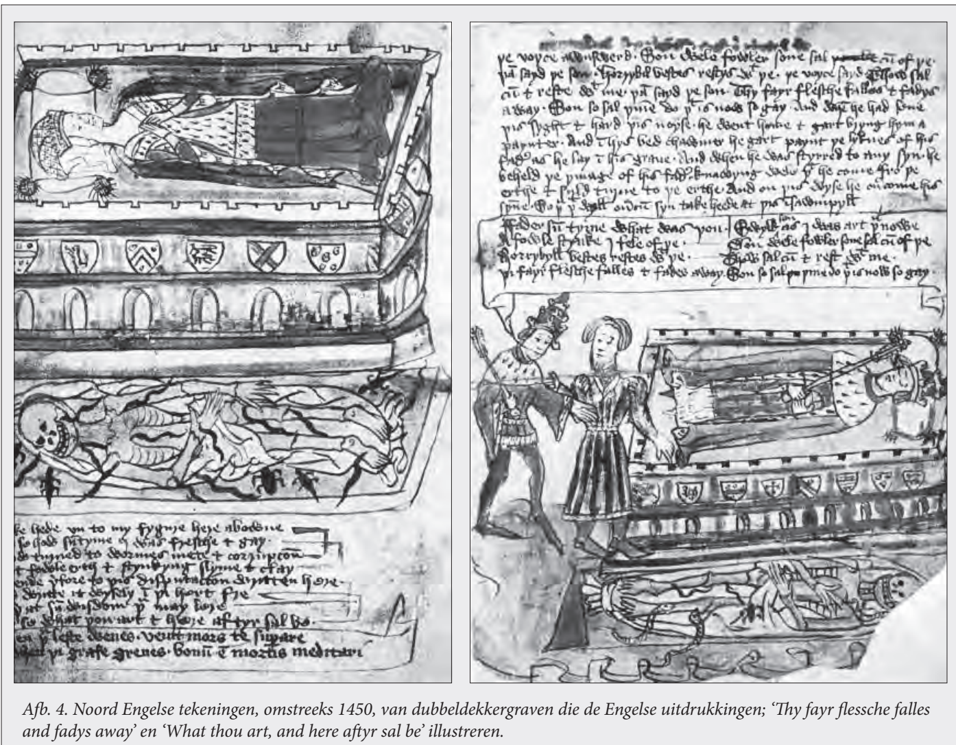
Afb. 4. Noord Engelse tekeningen, omstreeks 1450, van dubbeldekkergraven die de Engelse uitdrukkingen; ‘Thy fayr flessche falles and fadys away’ en ‘What thou art, and here after sal be’ illustreren.

dode weer in statiekledij ( het woord gisant komt van het Franse gésir , ‘liggen’). Bij de gisant vallen de plooiën op natuurlijke wijze langs het lichaam naar beneden, de stand van de armen is in overeenstemming met de staat van levenloosheid, de ogen zijn uiteraard gesloten. In de latere middeleeuwen, toen men de dingen hoe langer hoe meer natuurgetrouw wilde weergeven, voelde men de discrepantie in de pseudo-gisant goed aan. Er werden dan ook diverse pogingen ondernomen om van een ‘liggend-staand’ beeld een natuurlijke voorstelling te maken van een opgebaarde dode, waarbij de ogen uiteraard gesloten moesten zijn. Zo kwam men tegemoet aan de realiteitsdrang; door de beeltenis van staatsiekleding te voorzien, maakte men tegelijkertijd de waardigheid die de persoon in kwestie tijdens zijn of haar leven had gehad zichtbaar.