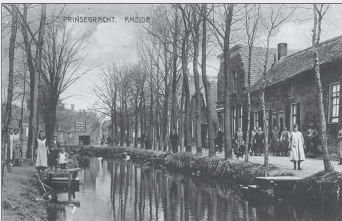
Werd de Prinsegracht vernoemd naar de erfprins Willem II?