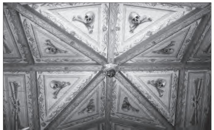
De beschilderde onderzijde van de baldakijn.

De baldakijn is in de loop der eeuwen aan verschillende restauraties onderworpen geweest: het is bekend dat in 1727, 1746, 1828 en 1877 werken zijn uitgevoerd. Wat deze werken precies ingehouden hebben is onduidelijk. De schilderingen worden al in 1754 genoemd; Aangezien de drager origineel lijkt, zal de baldakijn in de huidige verschijning waarschijnlijk grotendeels origineel zijn. Vergeleken met