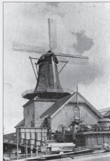
Zo stond houtzaagmolen “Ons Genoegen” op de werf in Alblasserdam.