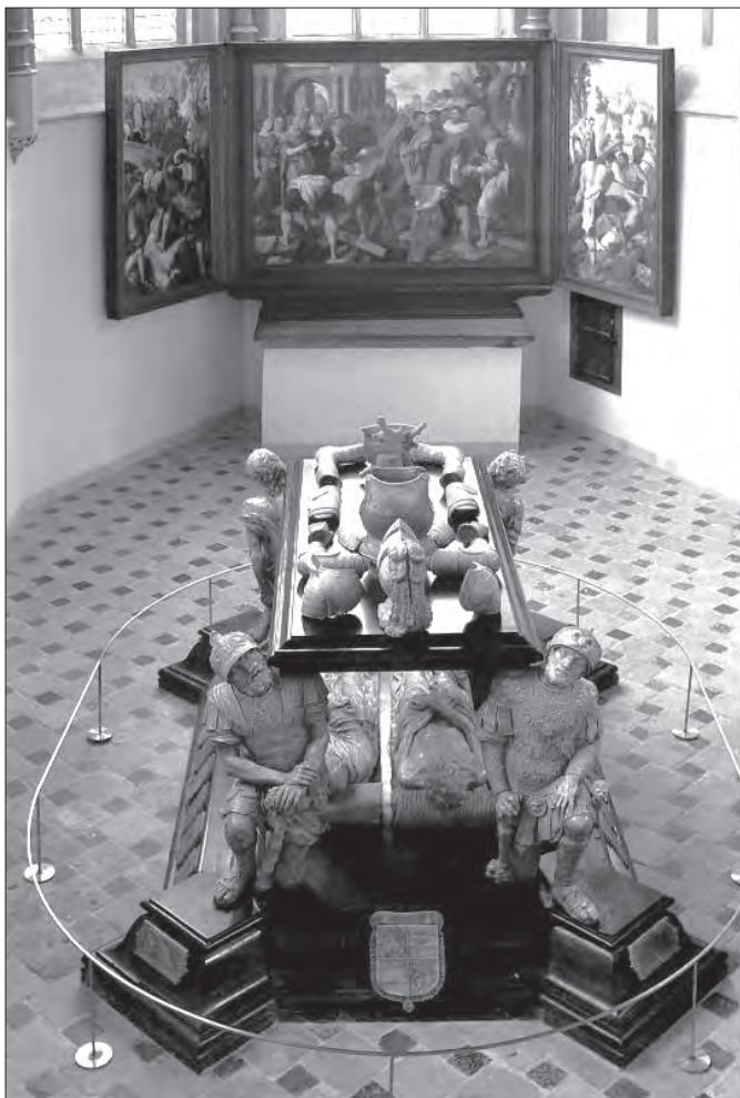
Afb. 5. Praalgraf van Engelbrecht II van Nassau en Cimburga van Baden in de Grote Kerk van Breda. Op de achtergrond het drielukkig De vinding van het Ware Kruis van Jan van Scorel (1495-1562).

naturen in zich: de persona personalis (de individuele koning) en de persona idealis , die overeenkomt met de dignitas .