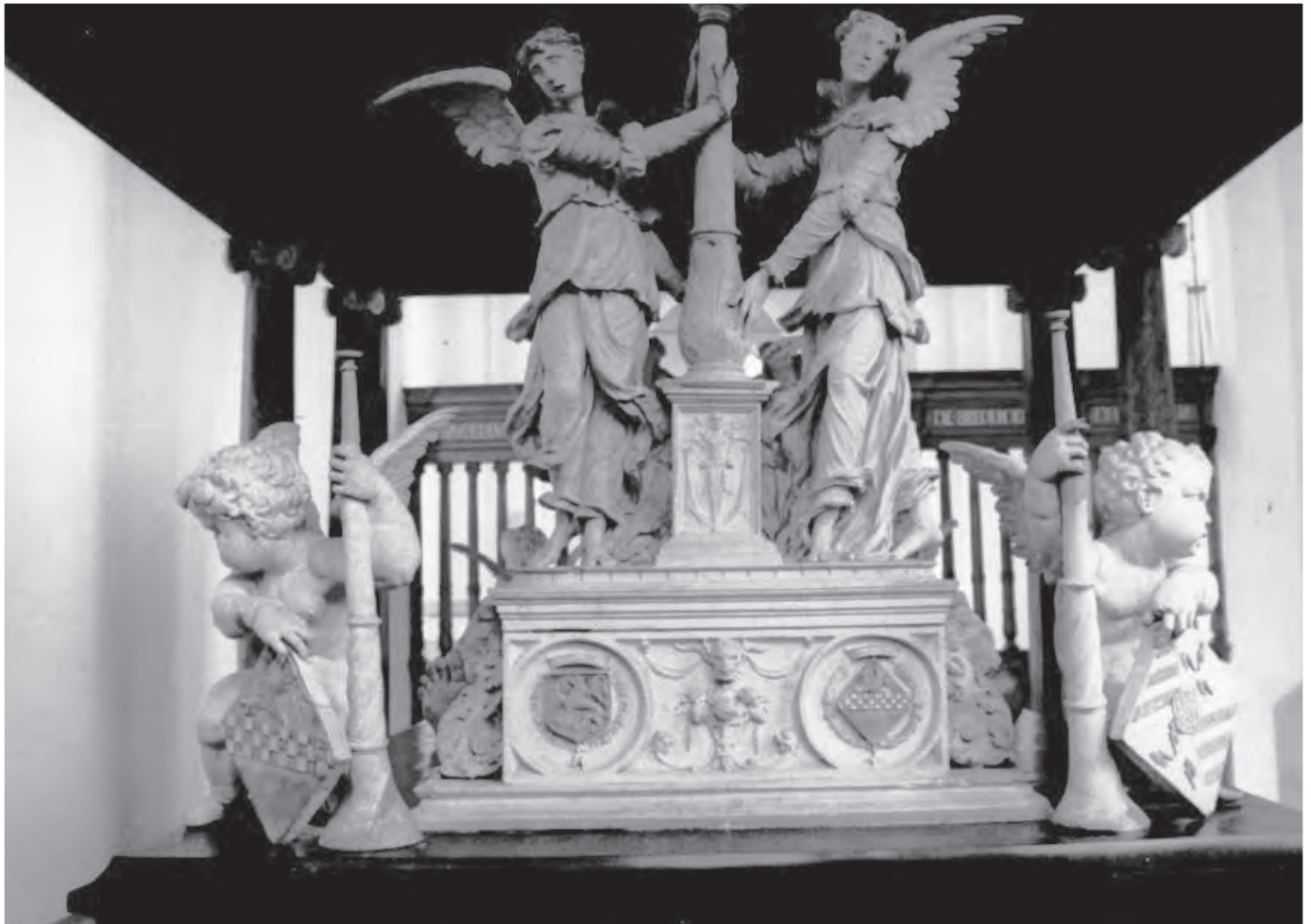
Afb. 3. Praalgraf van Reinoud van Brederode en Philippote van der Marck. Engelen aan weerszijden van een brandende flambouw, putti met familiewapens en omgekeerde toortsen.

tieve echtgenoten liggen losjes over elkaar in de schoot, net zoals in Vianen 8