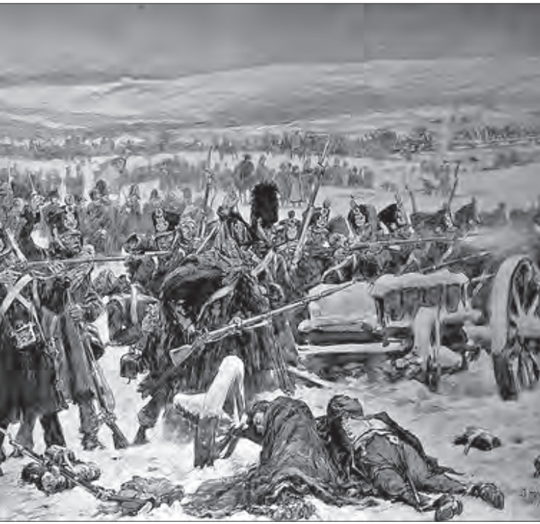
Hollandse infanterie bij de bruggen over de Berezina, Veldtocht naar Rusland (1812) Schoolplaat naar een schilderij van Jan Hoyneck van Papendrecht.

voorraden. Wegens voedselgebrek moest het leger zich in de winter weer terugtrekken uit Rusland. Vooral de slag aan de Berezina 9 op 26 – 29 November 1812 eiste een groot aantal slachtoffers. Om de rivier over te kunnen steken werden twee bruggen geslagen. Eén daarvan werd aangelegd door 400 Nederlandse pontonniers onder bevel van kapitein G.D. Benthien 10 . Via de bruggen was ontsnapping mogelijk voor Napoleon en de restanten van zijn Grande Armée. Tussen de 15.000 en 25.000 Nederlandse militairen nemen aan deze veldtocht deel maar slechts enkele honderden keren behouden terug.