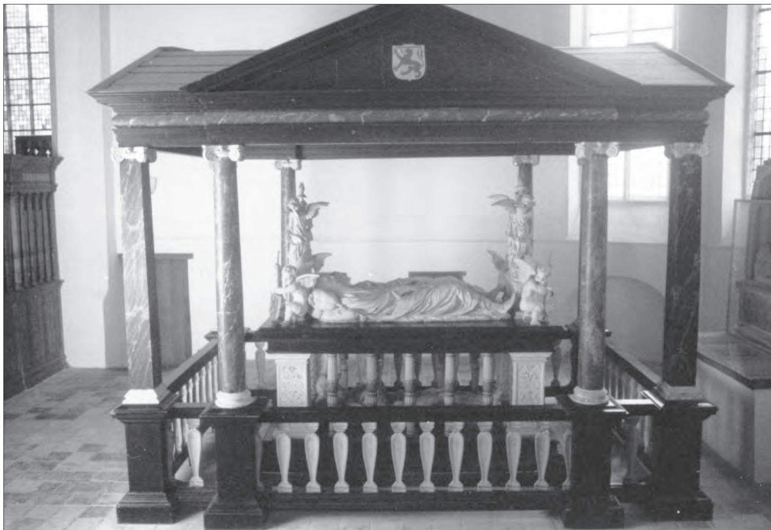
Afb. 1. Vianen, N.H. kerk, praalgraf van Reinoud van Brederode en Philippote van der Marck.

In het noordelijke zijkoor van de N.H. kerk te Vianen bevindt zich het praalgraf van Reinoud van Brederode (†1556) en van zijn echtgenote Philippote van der Marck (†1537). Het monument behoort tot het type 'dubbeldekkertombe'. De benaming geeft al aan dat de tombe over twee dekplaten beschikt. Op de bovenste liggen de beeltenissen van de beide echtelieden, elk met het hoofd rustend op een kussen, de handen losjes over elkaar in de schoot en de benen iets opgetrokken. Hun lichamen zijn in een laken gewikkeld, dat de voeten onbedekt laat. Hun ogen zijn gesloten (Afb. 2).