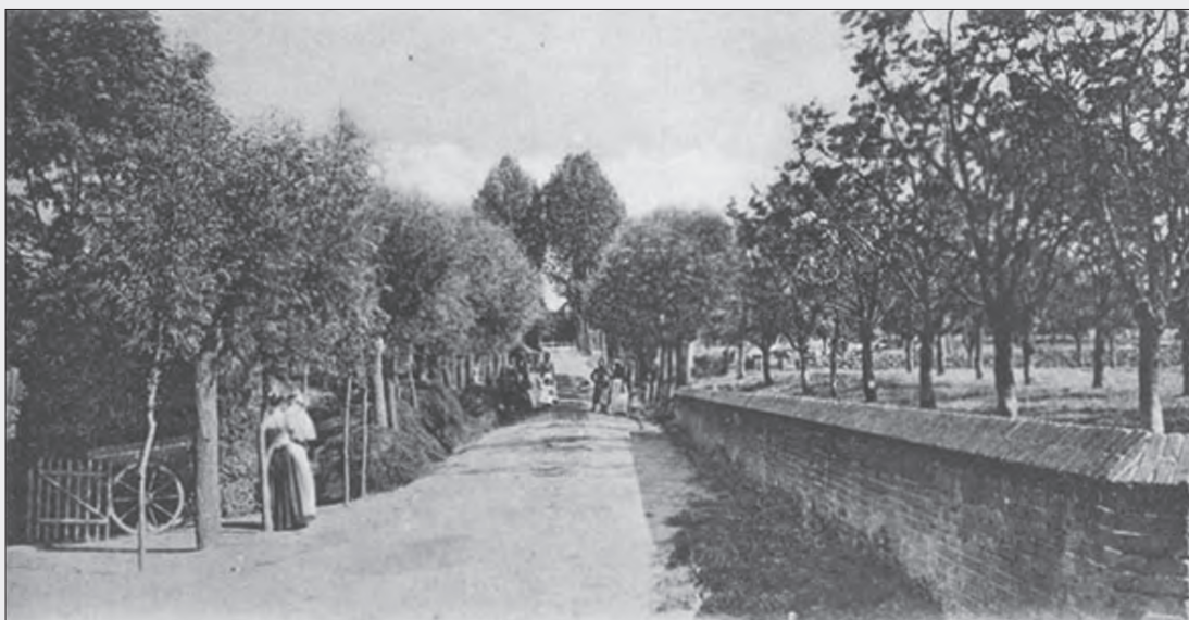
Was de 'pollie' of Paramasiebaan in 1644/45 de 'paille-maillebaan' van Ameide?