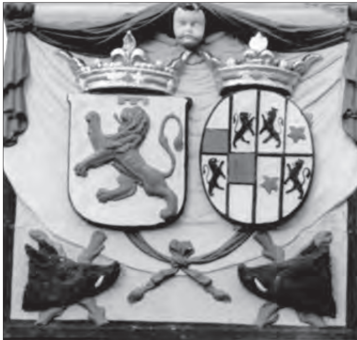
Wapens op de voorgevel van het Stadhuis van Ameide.