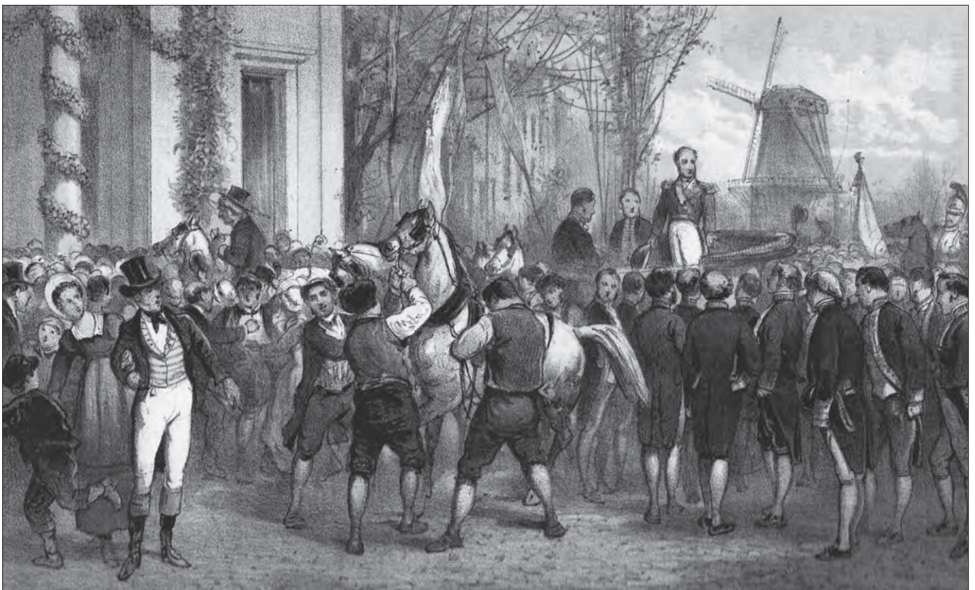
Aankomst van koning Willem I in Amsterdam op 2 december 1813 (P.W.M. Trap, 1880).

Helaas zit er een grote zwarte wolk aan de lucht, wat precies past in de geschiedenis van Ameide. In de bestuursvergadering, gehouden op 3 oktober, van de christelijke school is het besluit genomen niet met de kinderen aan de feestelijkheden deel te nemen. Dit