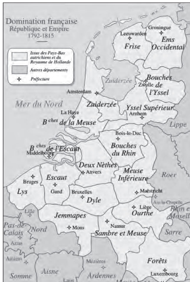
De departementen van het Koninkrijk Holland en de Oostenrijkse Nederlanden in het Franse Keizerrijk.

Bij zijn aankomst in Amsterdam op 14 juli 1810 was Lebrun 71 jaar oud en werd beschreven als een vriendelijke, erudiete man met een grote belangstelling voor en kennis van de klassieken. Hij werd stadhouder-prins van de zes nieuwe noordelijke "Hollandse" departementen en mocht rechtstreeks met Napoleon communiceren. Op 1 januari 1811 trad het Franse bestuur definitief in werking en werd Lebrun gouverneur-generaal over de zes departementen. Deze kregen ook nieuwe namen. Maastrand werd herdoopt tot departement van de Monden van de Maas (Franse: Bouches-de-la-Meuse ). Het departement was ingedeeld in arrondissementen en kantons. Ameide en Tienhoven behoorden tot het arrondissement en kanton Gorinchem.