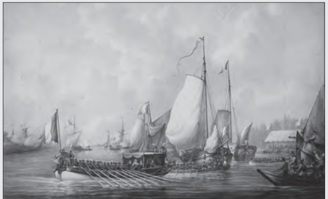
Overtocht keizerin Maria Louise van Sleuwijk naar Gorkum (5 oktober 1811) M. Schouman

(Bron: folder Historische Vereniging Werkendam en de Werken ca).