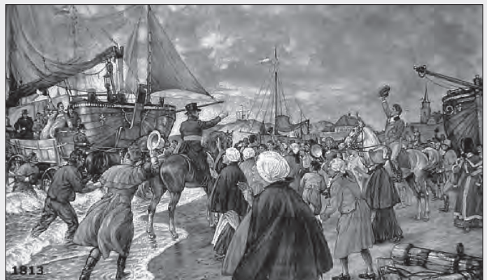
Landing van de Prins van Oranje in Scheveningen (Schoolplaat J.H. Isings Jr., 1956).

(Schilderij van J.W. Pieneman, 1779-1853, 70 x 86,5 cm, Rijksmuseum, Amsterdam).