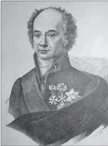
Goswin de Stassart, Prefect van departement Bouches de la Meuse (Monden van de Maas).

De landdrost van Maasland, Carel Gerard Hultkamp, is na de inlijving in het Franse keizerrijk nog tot 1 januari 1811 Prefect van Maasland. Op die datum wordt de