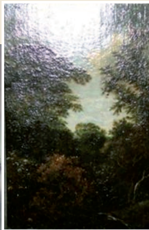
Links: "Twee lachende jongen" en rechts "Bosgezicht met bloeiende vlier".