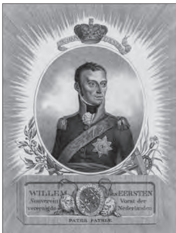
Willem den Eersten, Souverein Vorst der vereenigde Nederlanden.