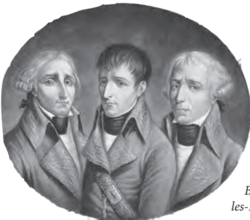
De drie Franse consuls (vlnr. Jean-Jacques Régis de Cambacérès, Napoléon Bonaparte, Charles-François Lebrun).

Keizer Napoleon stuurde Charles-Francois Lebrun 3 naar het nieuwe gebied om orde op zaken te stellen. Lebrun was een oude getrouwe van Napoleon die al in 1799 had meegedaan aan de staatsgreep van Napoleon. Lebrun werd naast Napoleon als derde consul een belangrijk adviseur tijdens de periode van het Consulaat (1799-1804).