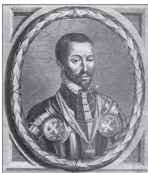
Hendrik van Brederode (1531-1568, bijgenaamd de Grote Geus.

Edelen en de opstand tegen de Spaanse overheersing in de Nederlanden. Zijn naam leeft voort in de 'Hendrik van Brederodeschool', de openbare basisschool te Ameide.