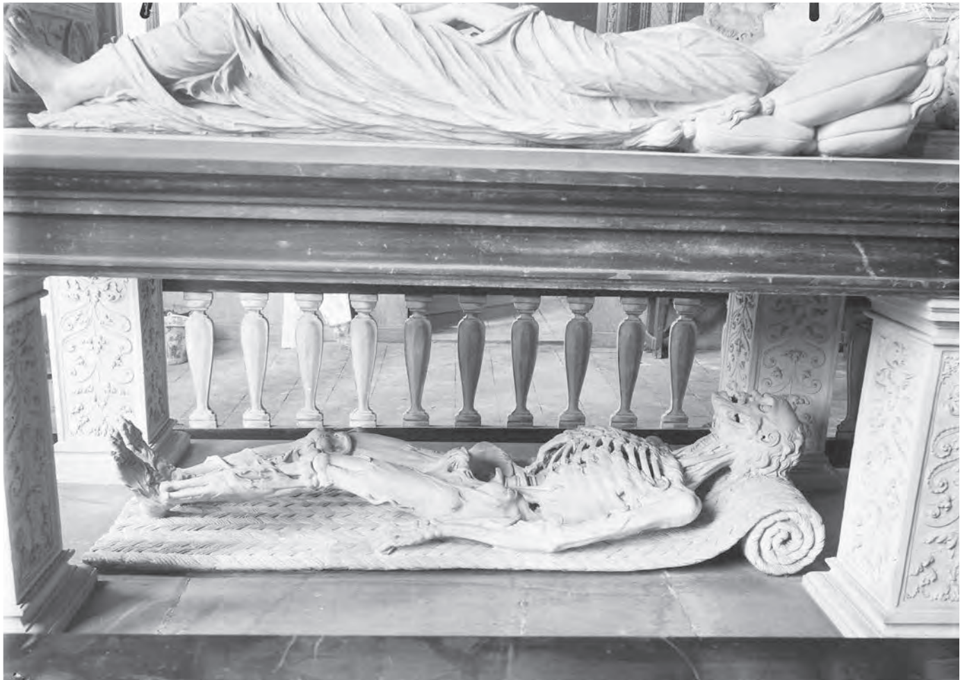
Afb. 2. Praalgraf van Reinoud van Brederode en Philippote van der Marck. Op de bovenste dekplaat bevinden zich twee transi's, op de onderste dekplaat één.

andere gegevens betreft naar de meest recente literatuur verwijzen. 2