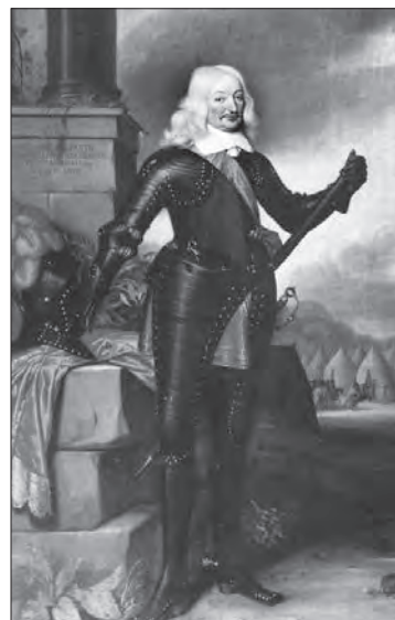
Johan Wolfert van Brederode als veldmaarschalk van het Staatse leger.

van Solms, de echtgenote van Stadhouder Frederik Hendrik. Hierdoor wordt Johan Wolfert de zwager van Frederik Hendrik en neemt zijn macht verder toe. In 1641 wordt hij benoemd tot Veldmaarschalk van het Staatse Leger en is dan na de Stadhouder de belangrijkste militair.