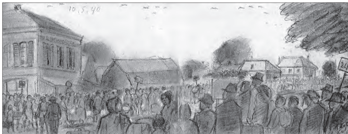
“Onafzienbare rijen Wageningers trokken op den middag van 10 mei bepakt en bezakt naar den haven.” (tekening, P. de Jong).

5 In 1942 heeft P. de Jong een schilderij vervaardigd op basis van deze tekening (Collectie Museum Casteelse Poort, Wageningen).