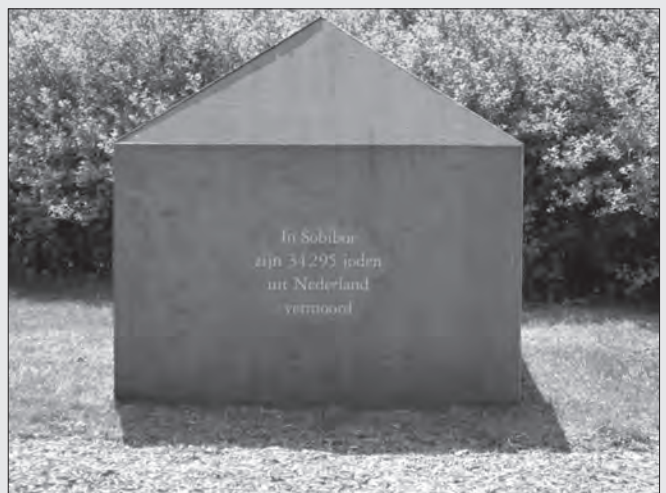
Deel van het monument 'Tekens in Westerbork' te Hooghalen (gemeente Midden-Drenthe) bestaande uit vijf graftombes van natuursteen, met daarop teksten die verwijzen naar verschillende kampen.

vrouwen en kinderen. Niemand van hen zou het vernietigingskamp overleven. Nog geen drie maanden later, op 14 oktober 1943, vond er in het kamp een grote opstand plaats. Honderden gevangenen lukte het die dag te ontsnappen. Sobibor werd direct gesloten en met de grond gelijk gemaakt. Alle documenten werden vernietigd. De SS wist bij elke spoor van de 'Endlösung' op deze plek uit te wissen. Het terrein werd met boompjes beplant. Alleen een heuvel met een monument getuigt van de massale slachting die hier plaatsvond. Die heuvel bestaat uit de as van meer dan 170.000 Joden uit verschillende Europese landen die in Sobibor waren vermoord, waaronder ruim dertigduizend uit Nederland.