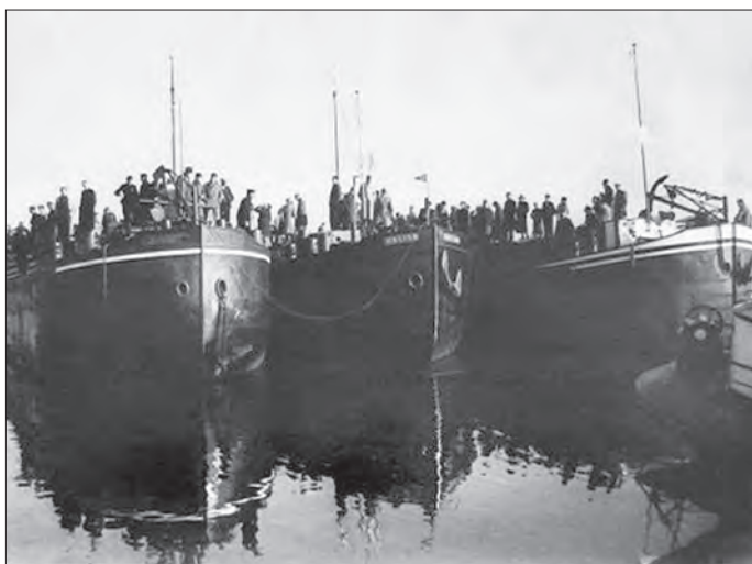
Aan boord van de 'Kempenaars'.