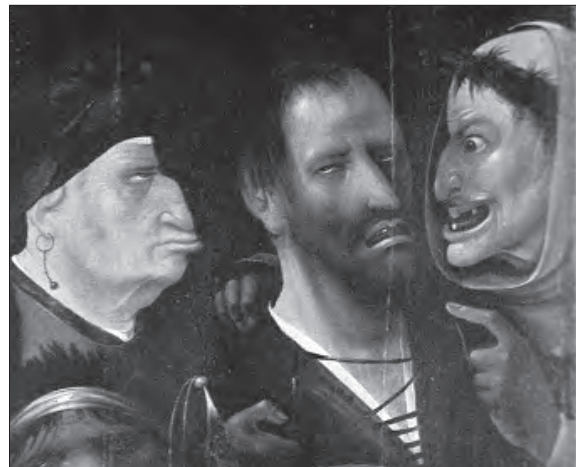
De slechte en de goede moordenaar.

niet aan, zoals in Bosch' gelijknamige voorstellingen. Met gesloten ogen, met lijdend neergetrokken mond draagt hij het kruis. In de linker benedenhoek houdt de Heilige Veronica het doek met de afdruk van het ware gelaat. Ook zij houdt de ogen gesloten, maar glimlacht. Om beiden heen barst de menselijke hel los, een dicht opeen gedrongen klun van mannen, wier gezicht menselijk, al te menselijk is. Uitzinnige sensatielust, brullende grofheid en geniepig sadisme worden zonder omhaal weergegeven.'