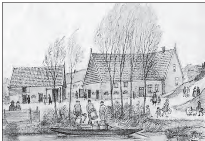
"Overall langs den Lekdijk trof men Wageningers in kwartier." (tekening, P. de Jong).

Aan de evacués werd bekend gemaakt dat inscheping voor de terugtocht vrijdagmorgen om 06.00