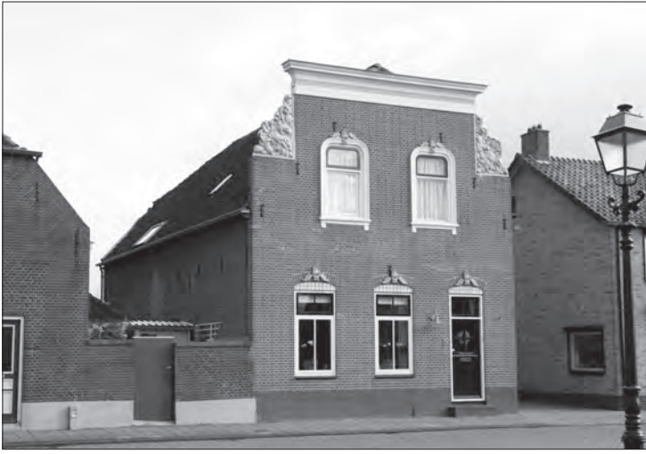
Prinsengracht 19 in 2015. De oplettende kijker zal zien dat de gevel – vooral de onderste helft – sterk veranderd is in vergelijking met de Ansicht op pagina 37 van ca. 100 jaar geleden.