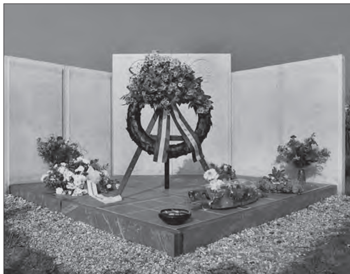
Monument in Szczedrzyk (Polen) ter nagedachtenis van de Nederlandse joden die omkwamen in de werkkampen van de staalwerken van Malapane / Ozimek in Polen.