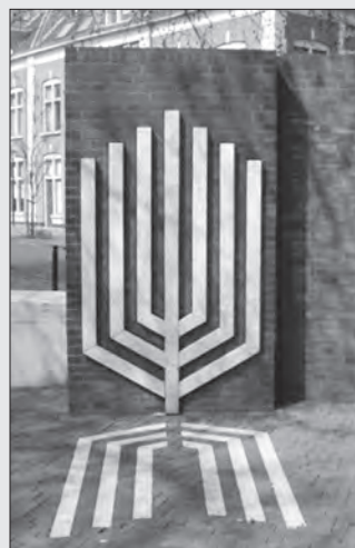
Het Joods Monument in Gorinchem bij het Melkpad.

In januari 1941 waren er in de synagoge al ernstige vernielingen aangebracht door Duitsers en NSB-ers. Kort na de plechtige viering van de honderdste verjaardag van de synagoge in mei 1942 begonnen de deportaties, die aan meer dan de helft van de Gorkumse joden het leven zouden kosten. De synagoge werd meteen na de oorlog hersteld, maar werd wegens het tekort aan leden verkocht en in 1958 afgebroken. De joodse gemeente werd in