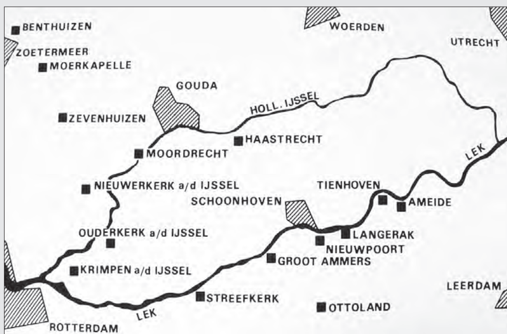
Gemeenten waar Wageningers gedurende de evacuatie van 1940 waren ondergebracht.

Op 1 januari 1939 had Ameide 1789 inwoners in ca. 520 woningen en had Tienhoven 373 inwoners in ca. 70 woningen. Als percentage inwoners was het aantal evacu s in Ameide 43,0 % en Tienhoven 157,4%. De opvang in Ameide en Tienhoven was heel verschillend van aard en werd mede bepaald door de verschillen in bebouwing. In Ameide merendeels woonhuizen en enkele boerderijen, in Tienhoven merendeels boerderijen en enkele woonhuizen. Daardoor verbleven er in Ameide gemiddeld 4,1 personen per adres en in Tienhoven 20,2. In Ameide waren er 5 adressen (van de 189) waar 20 of meer evacu s gehuisvest waren, bij de dijkopzichter, (Voorstraat) en de boerderijen van Verboom (Achterweg), H. en Jac. Oosterom en G.C Terlouw (Prinsegracht) en A.F. Kool (Hogewaard). Het hoogste aantal – 50 personen – was ondergebracht bij G.C. Terlouw. In Tienhoven waren er 14 adressen (van de 29) waar 20 of meer evacu s gehuisvest waren. Het hoogste aantal – 52 personen – was ondergebracht bij A.Wink (Hoogendijk no. 20 nu Lekdijk 30).