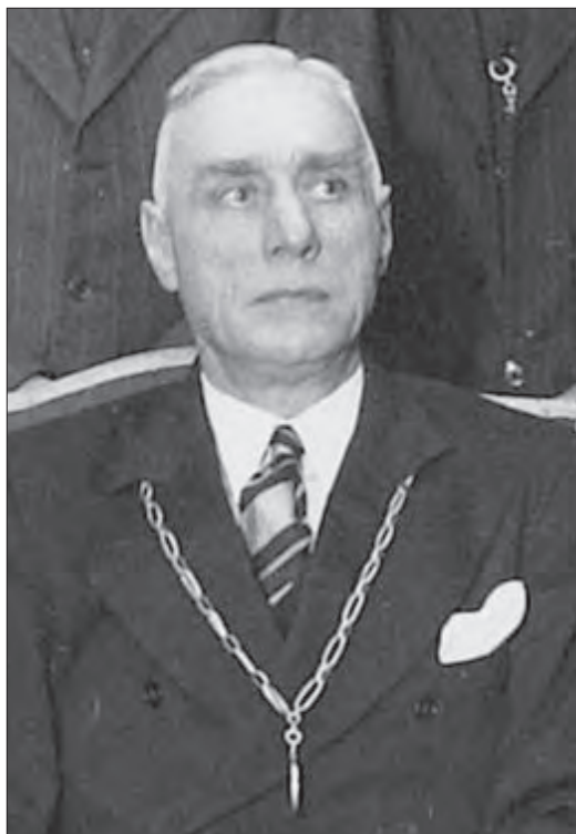
M.J. IJzerman, burgemeester van Wageningen (1 april 1938 – 2 december 1943).