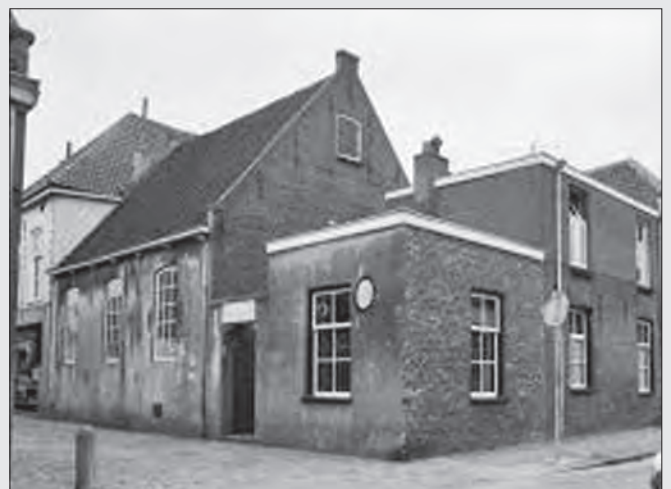
Voormalige Synagoge in Vianen, Bakkerstraat 8 (Rijksmonument).

Het aantal leden van de joodse gemeente van Vianen was begin van de 20 ste eeuw zo gering dat werd voorgesteld deze op te heffen. Ook de synagoge was ernstig in verval geraakt. In 1920 werd deze opheffing een feit. Vianen werd bij Utrecht gevoegd, enkele dorpen uit de omgeving vielen onder Leerdam. De synagoge werd verkocht en omgebouwd tot kerkzaal van de Protestanten Bond. In 1993 werd het gebouw aangekocht door het Nederlands Hervormd Comité. Aantal joden in Vianen en omgeving: 1809-51; 1840-49; 1869-61; 1899-68; 1930-8.