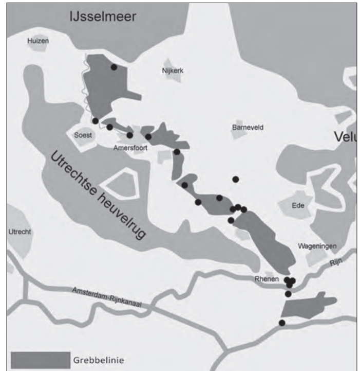
Overzichtskaart Grebbelinie van de Waal tot het IJsselmeer.