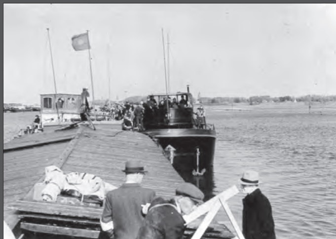
10 mei 1940. • Evacués verzamelen bij de haven van Wageningen. • Verzamelen, inschepen en onderweg