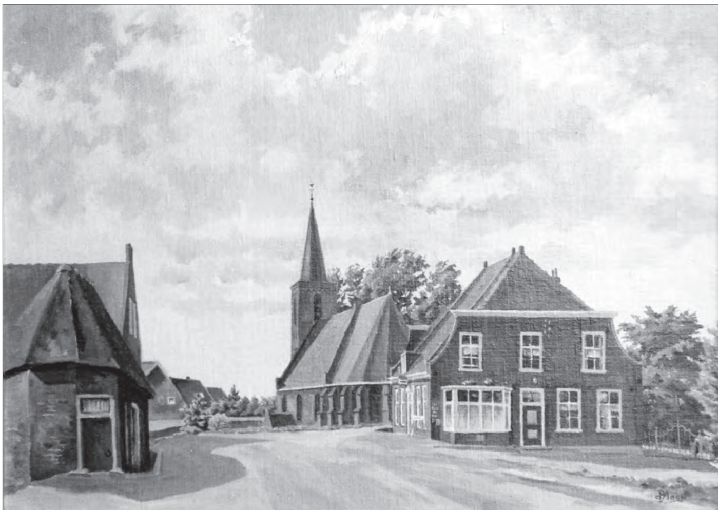
Tienhoven in de vorige eeuw, één van de vele schilderijen die meester De Hoon in onze omgeving heeft gemaakt.

Bij mijn weten heeft nooit iemand, anders dan uit bezorgdheid, mijn oom aangesproken op zijn riskan- te wijze van doen. Iedereen besepte immers dat het instituut-De Hoon niet aan veranderingen onderhe- vig was.