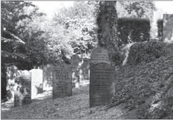
Overzicht Joodse gedeelte begraafplaats Leerdam.

Leerdam 4 In Leerdam hebben zich al vrij vroeg joden gevestigd. Vanaf de twintiger jaren van de zeventiende eeuw werd de plaatselijke Bank van Lening een aantal malen door een joodse pachter beheerd. In de achttiende eeuw nam het aantal joden toe, zij waren onder andere uit Middelburg afkomstig. Aanvankelijk werden de godsdienstoefeningen gehouden in een gehuurde zaal. In 1827 werd een synagoge in de Nieuwstraat gebouwd. In 1854 werd dit gebouw vervangen door de synagoge die tot 1935 in gebruik is geweest.