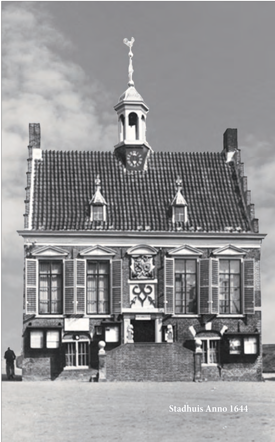
Stadhuis Anno 1644